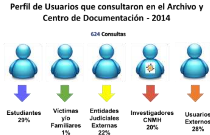
Grafica N° 3. Perfil de usuarios que consultan en el archivo y centro de documentación de DDHH.

Fuente: Dirección de Archivo de los Derechos Humanos. 2014.