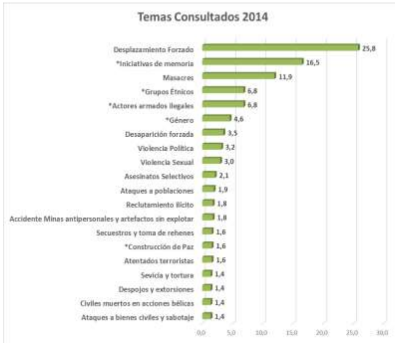
Grafica No. 4 Temas consultados. 2014