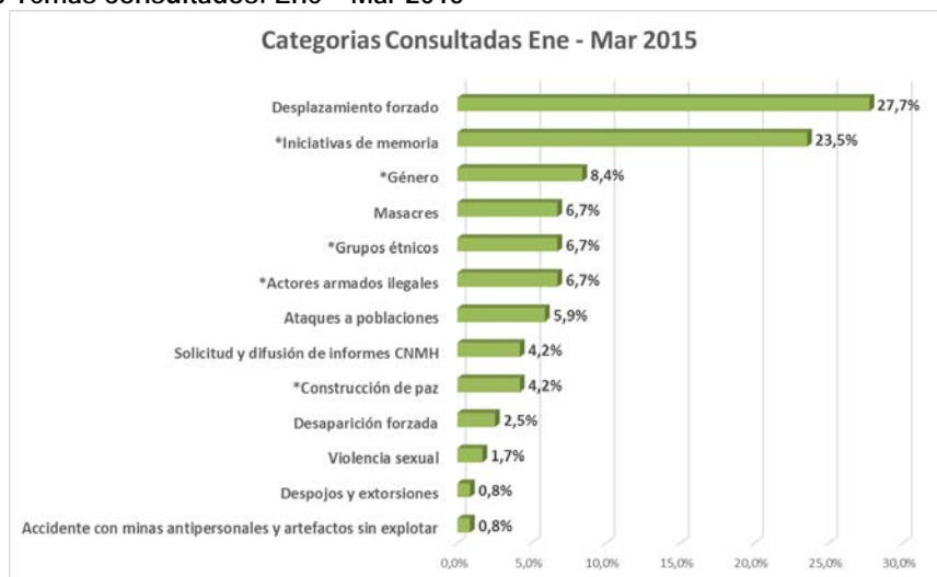
Gráfica No. 3 Temas consultados. Ene – Mar 2015