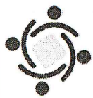
Cuadro No. 9 - SERVICIOS PÚBLICOS