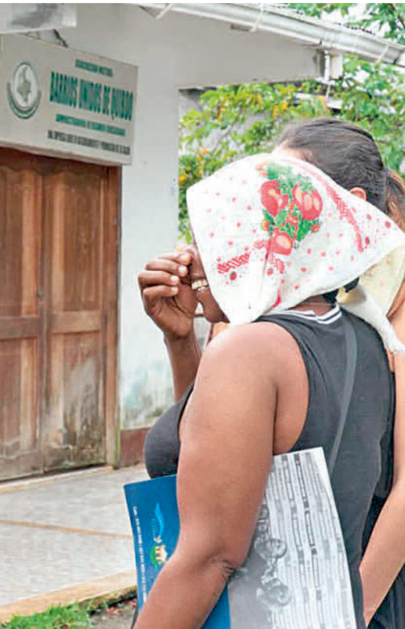
durante los cuales ha estado inmerso en diversas polémicas.