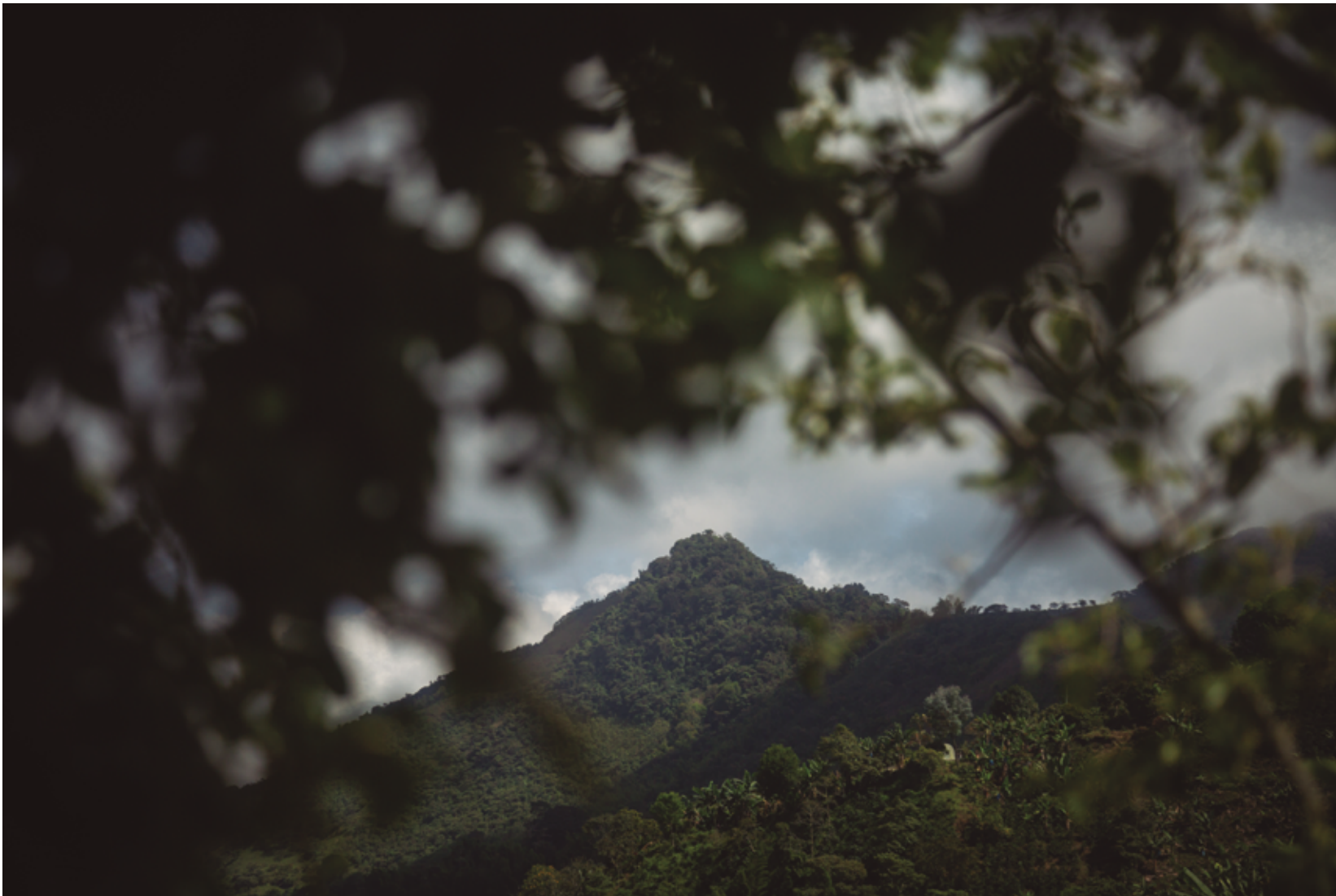
Varios cerros del Territorio Ancestral de San Lorenzo son considerados sitios sagrados por sus habitantes.