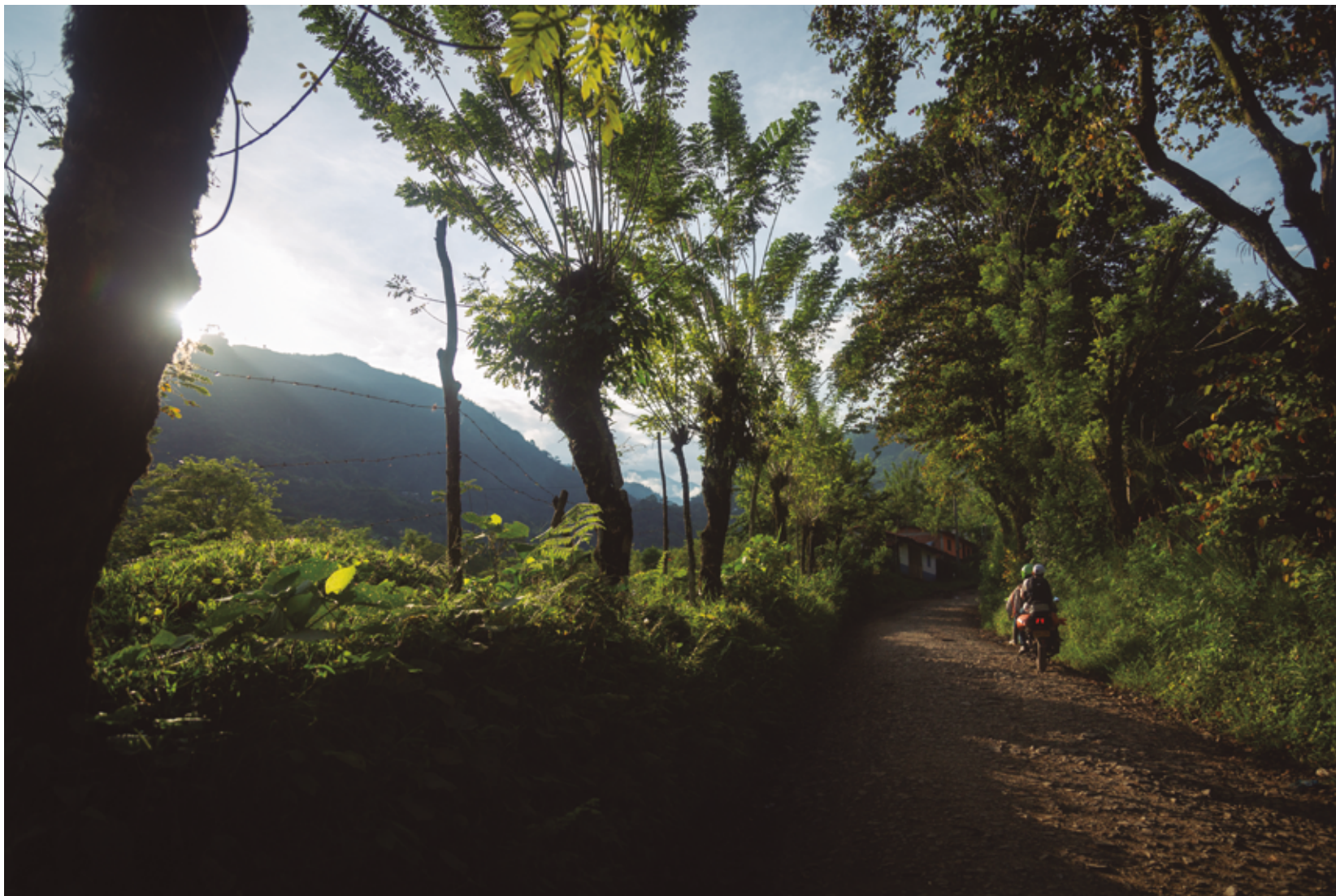
Camino en San Lorenzo.