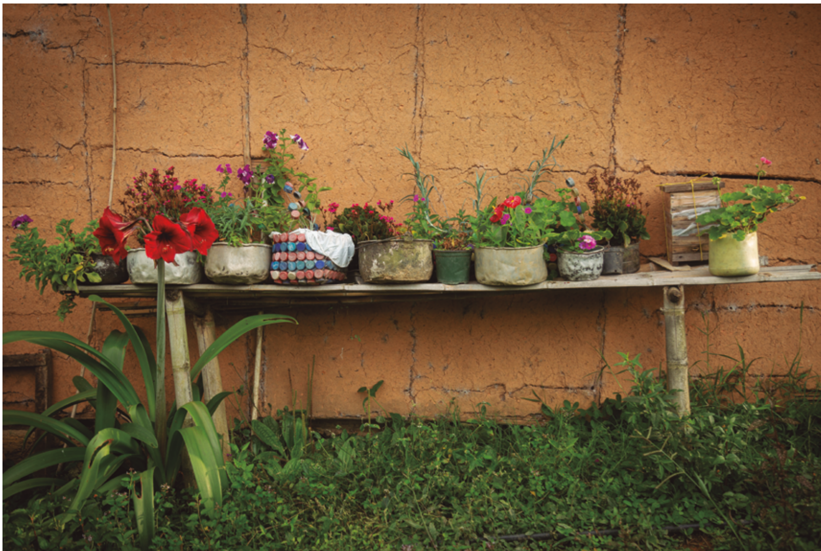
En la gran mayoría de las entradas de las casas de San Lorenzo lo primero que se ve son jardines llenos de plantas y flores. Se siembran en materas, ollas viejas y botellas dándoles un nuevo uso a estos recipientes.