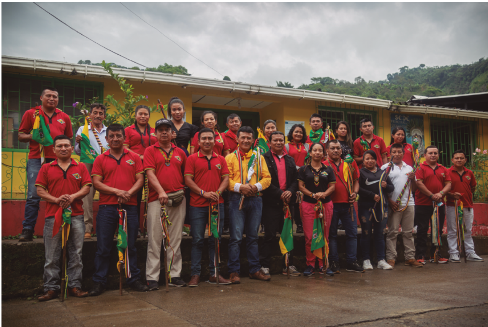
Grupo de cabildantes y autoridades tradicionales del resguardo de San Lorenzo de 2021.