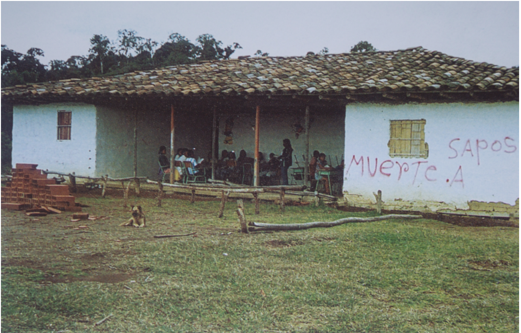
Los grafitis eran el recordatorio constante de la presencia de los paramilitares en el territorio. Imagen de la Escuela de La Línea, donde estudiaban 36 niños de las 24 familias que habitaban la comunidad. Tras la intensificación del conflicto armado interno, la mayoría de pobladores se desplazaron y quedó solo una familia.