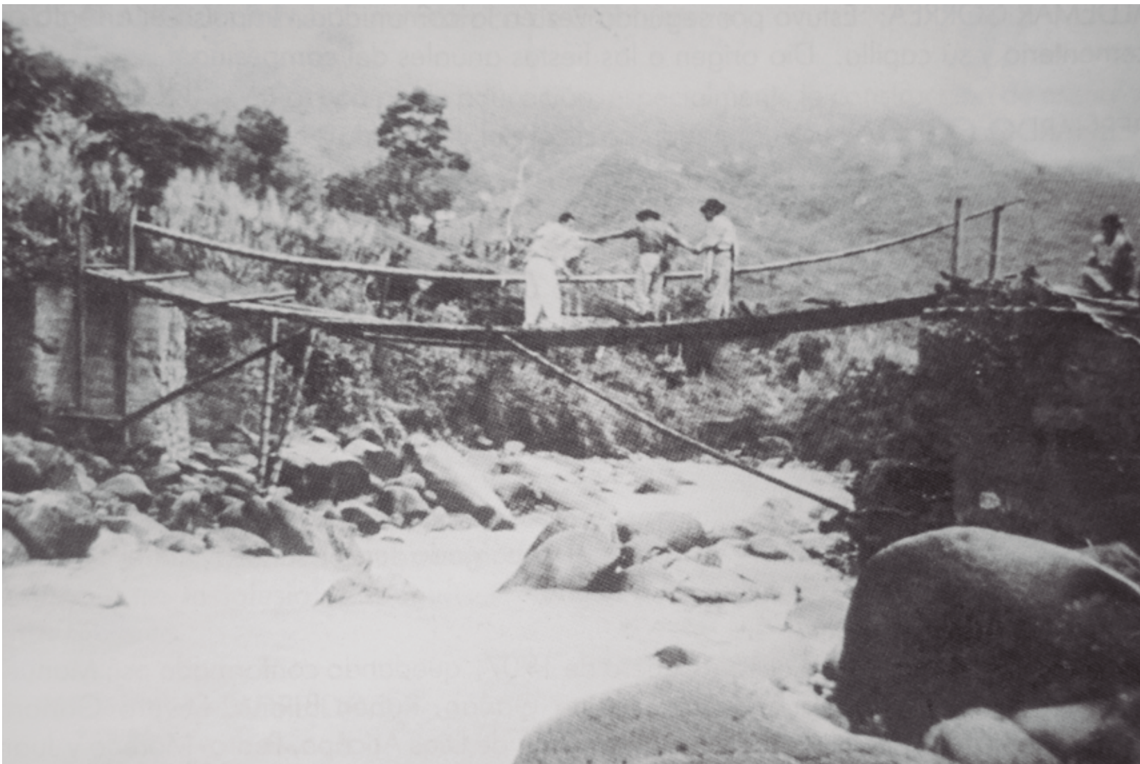
Los puentes, caminos y carreteras construidos a comienzos del siglo xx son el resultado del trabajo de las comunidades reunidas en convites. Puente colgante de guadua sobre el río Las Estancias, 1945.