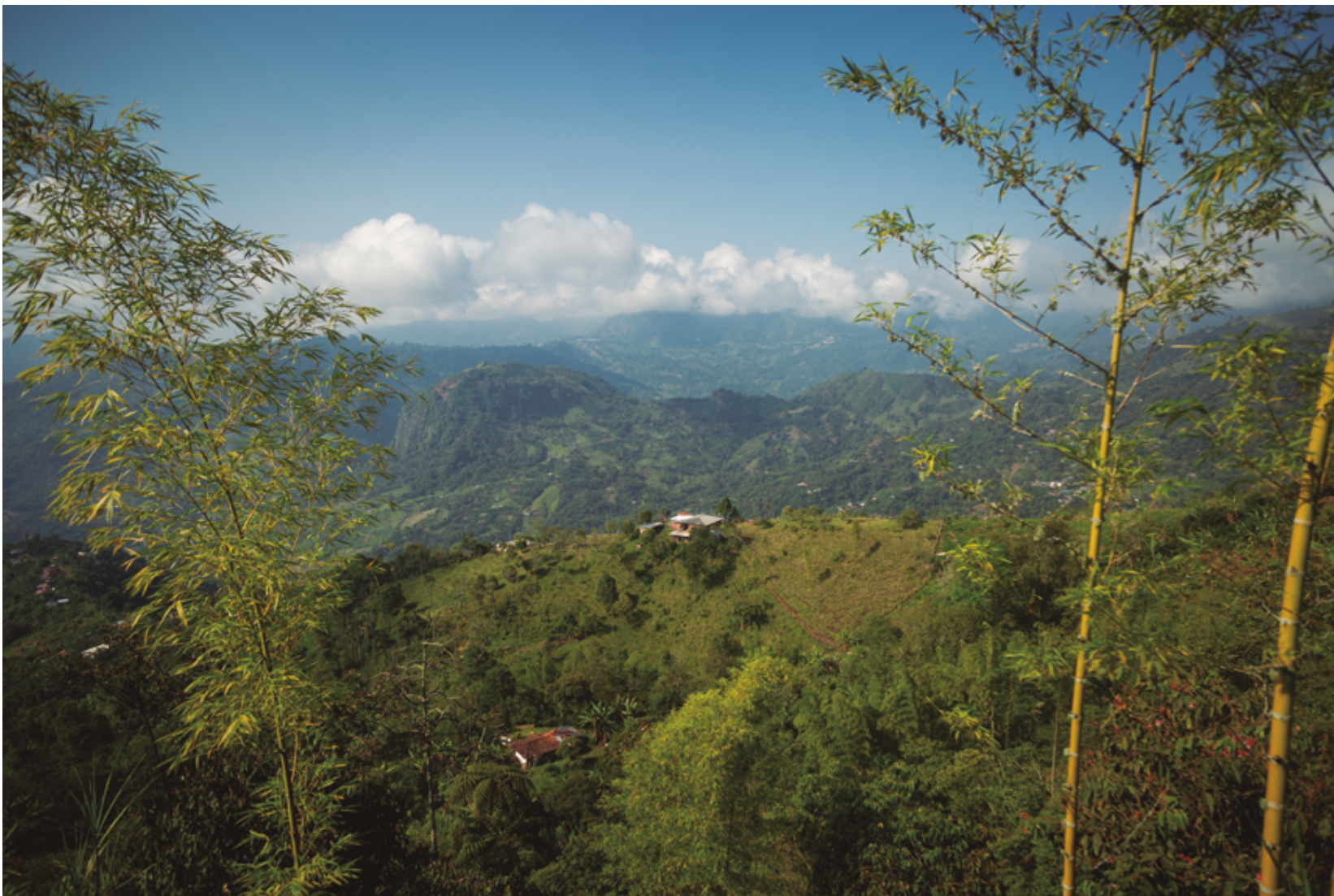
San Lorenzo se encuentra en los municipios de Riosucio y Supía en el corazón de la Cordillera Central. Se constituyó nuevamente como resguardo mediante la Resolución 010 del 29 de junio de 2000 expedida por el INCORA. Allí viven 14.317 indígenas en 21 comunidades.