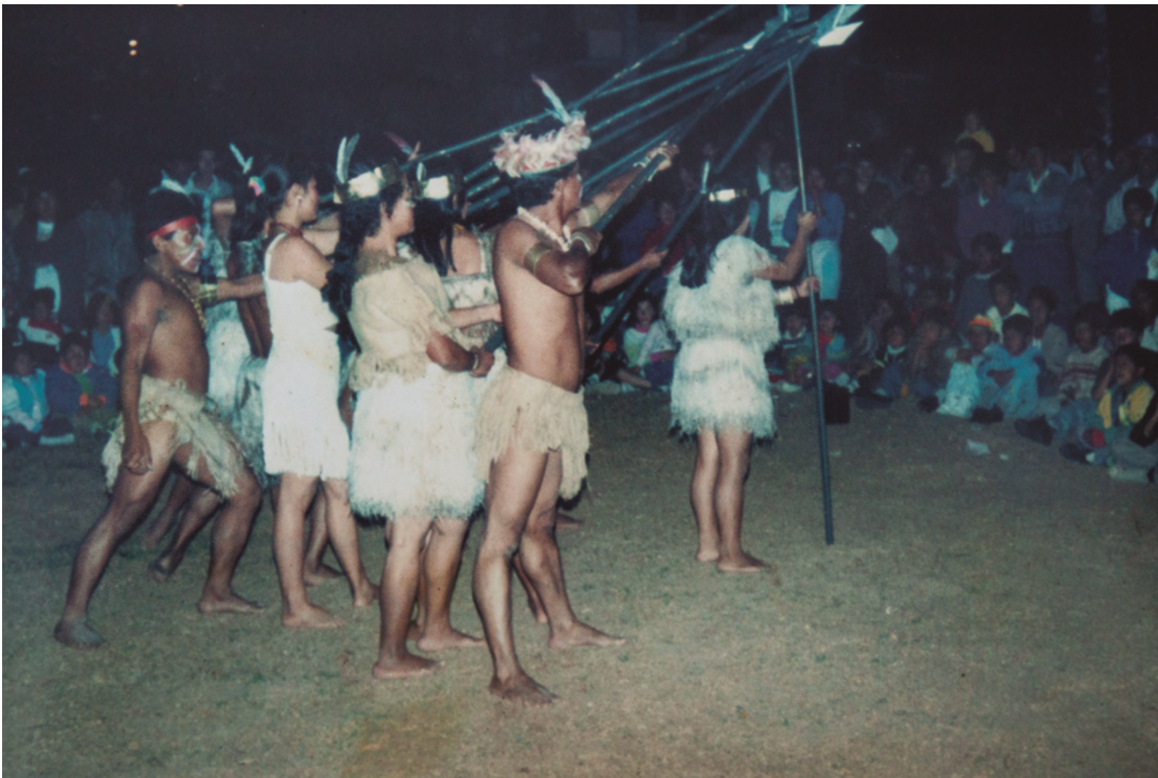
Imagen de archivo de grupo de danzas en San Lorenzo.