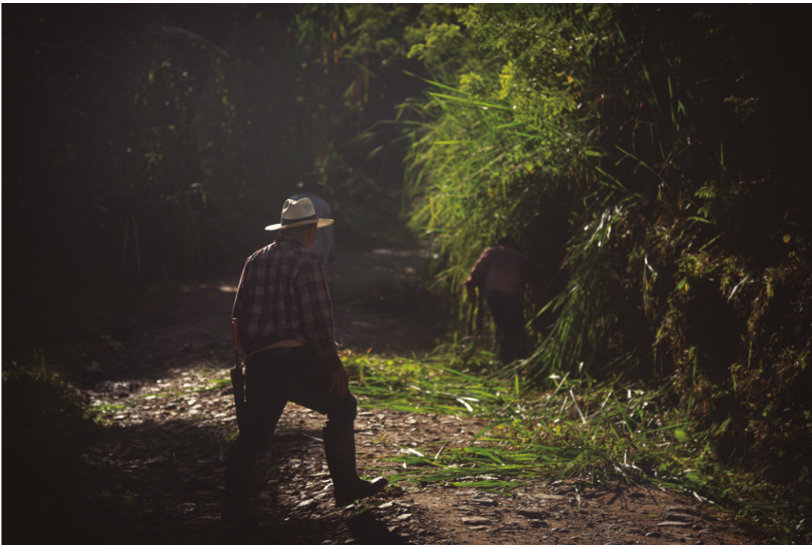
Minga de mantenimiento de caminos.