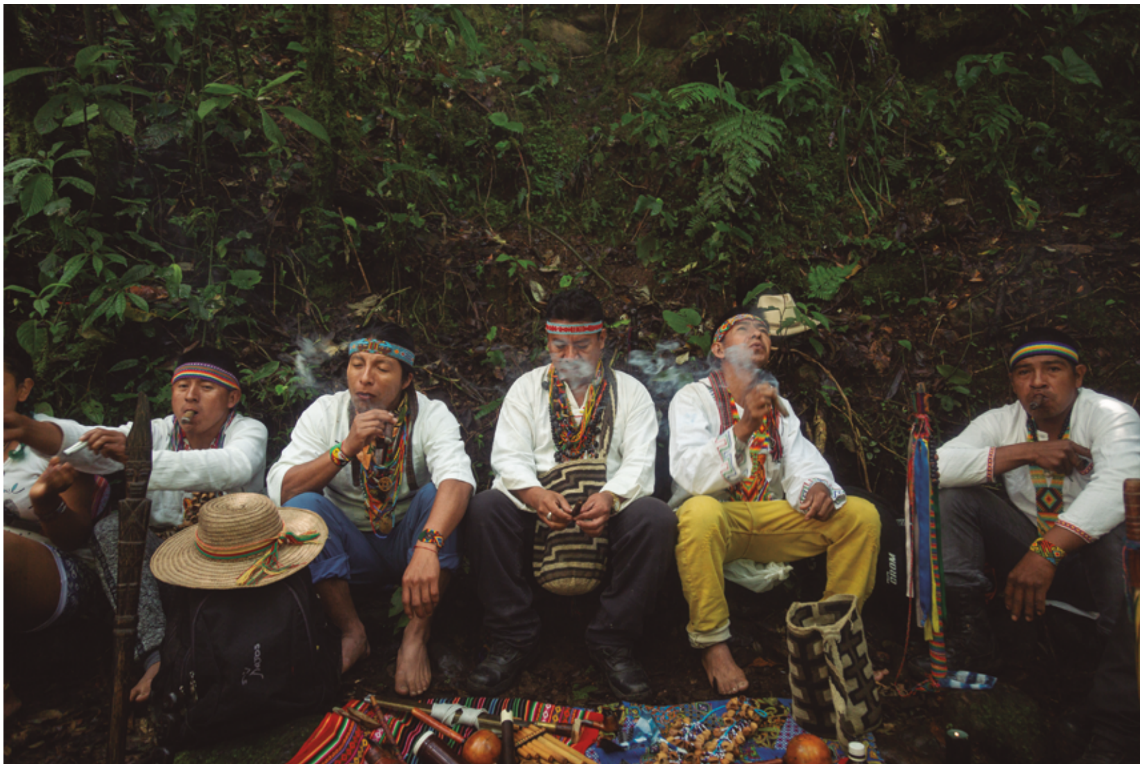
Jornada de acompañamiento espiritual de los médicos tradicionales al Comité Interpsicosocial en el sitio sagrado Cueva del Duende.