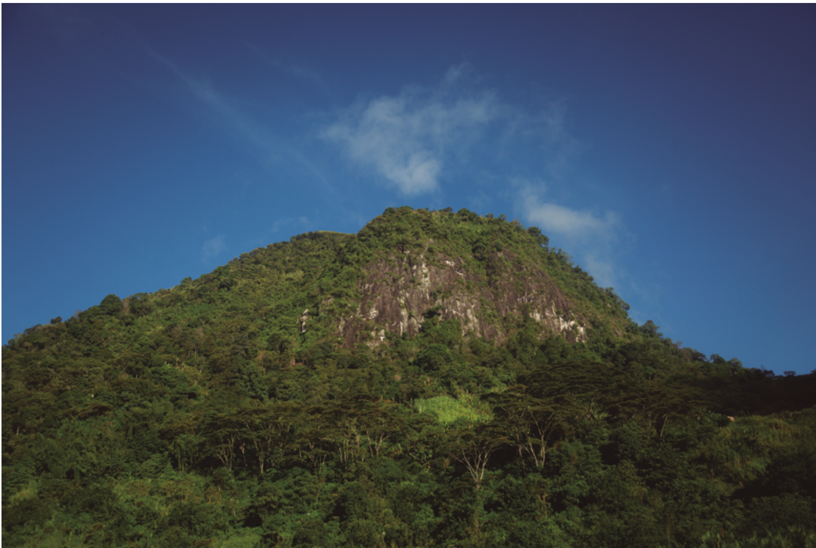
El cerro Buenos Aires, uno de los cerros tutelares que tiene el territorio, es uno de sus sitios sagrados más importantes.