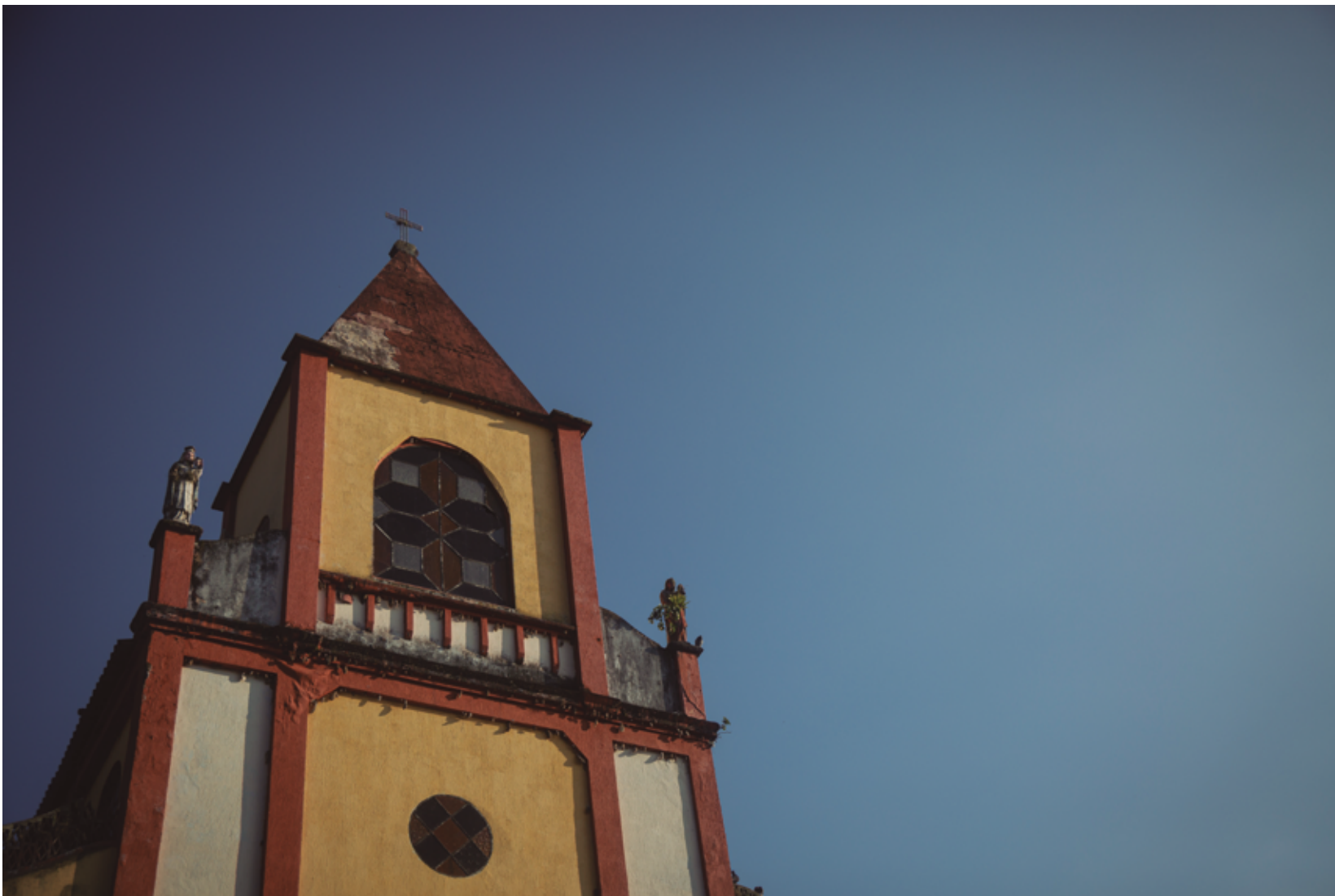
La estructura de la iglesia del Centro Poblado de San Lorenzo, la escuela y las casas, alrededor de la estación de policía, fueron afectadas durante las tomas de 1998 y 2001.