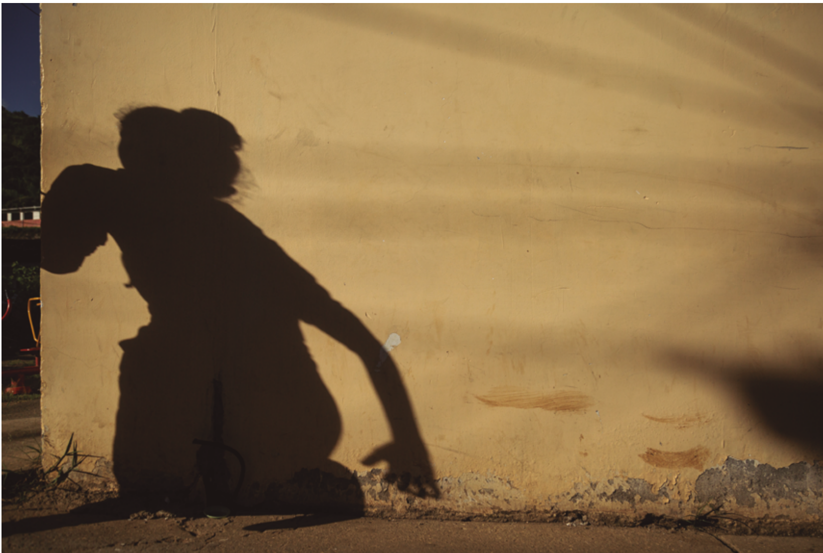
La población civil no tuvo tiempo de protegerse cuando las FARC tomaron el centro poblado en 2001. Una de las víctimas fatales fue Blanca Milena Guapache Taborda, de catorce años.