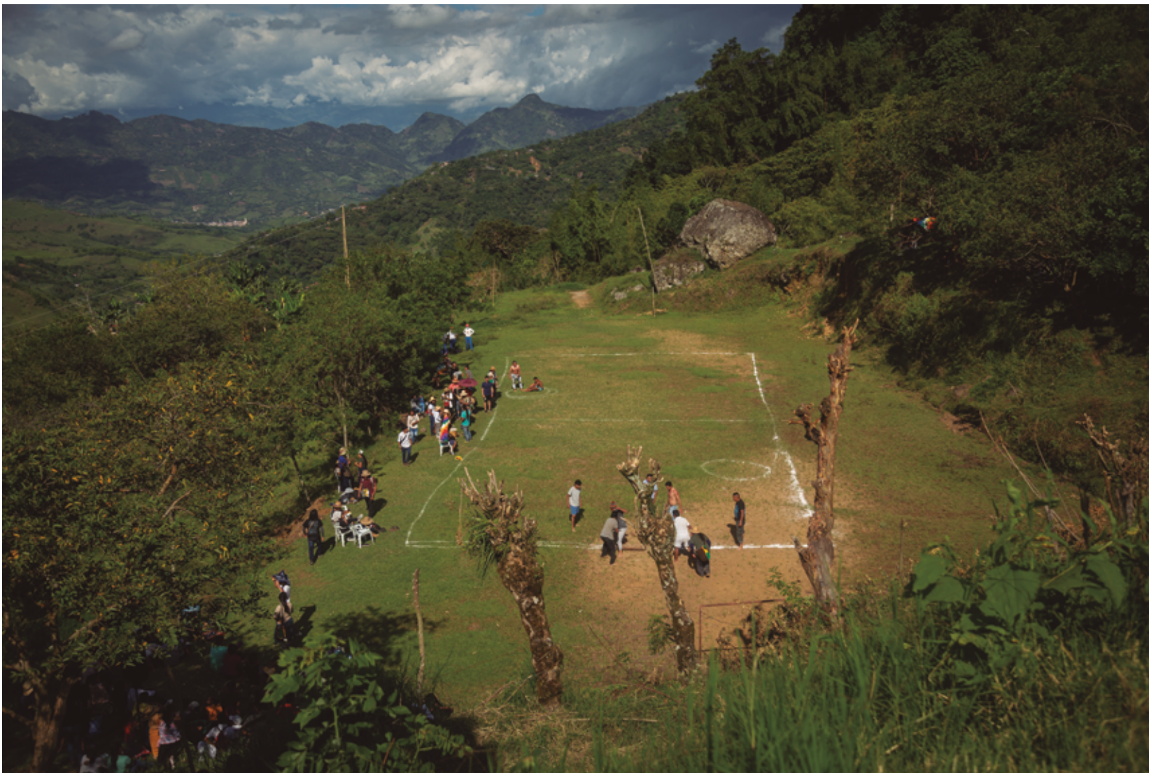
La Fiesta de la Memoria es un evento organizado por jóvenes de San Lorenzo que se celebra desde 2016. Allí se realizan actos musicales, de medicina tradicional, culturales y juegos tradicionales como el yapo. Fiesta de la Memoria 2021.