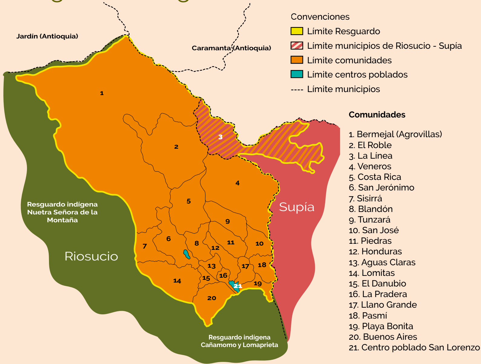
Mapa 2. Comunidades del Resguardo de San Lorenzo. Ilustración: Kevin Nieto Vallejo para CNMH.