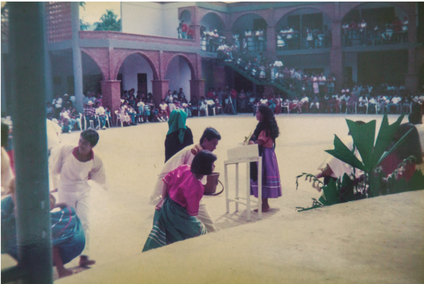
Imagen de un grupo de teatro representando un ritual de “angelito”.