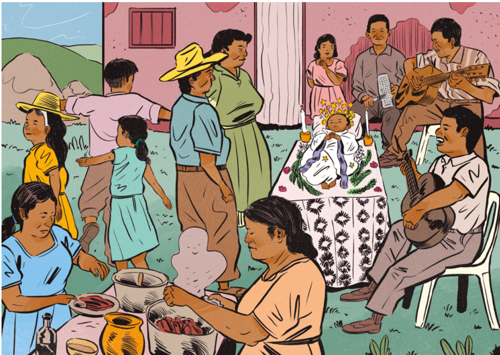
Recreación de la celebración de un “angelito”. Ilustración de Kevin Nieto Vallejo para el CNMH.