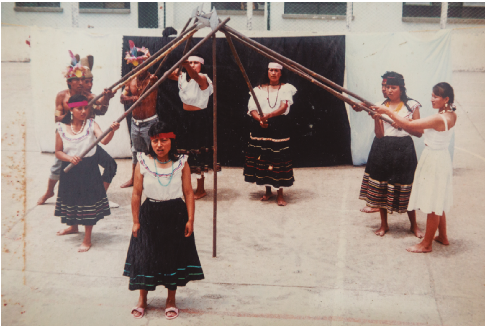
Imagen de archivo de un grupo de danzas en San Lorenzo.