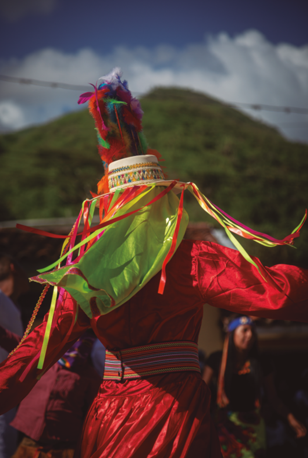
Danza en la Fiesta de la Memoria, 2021.