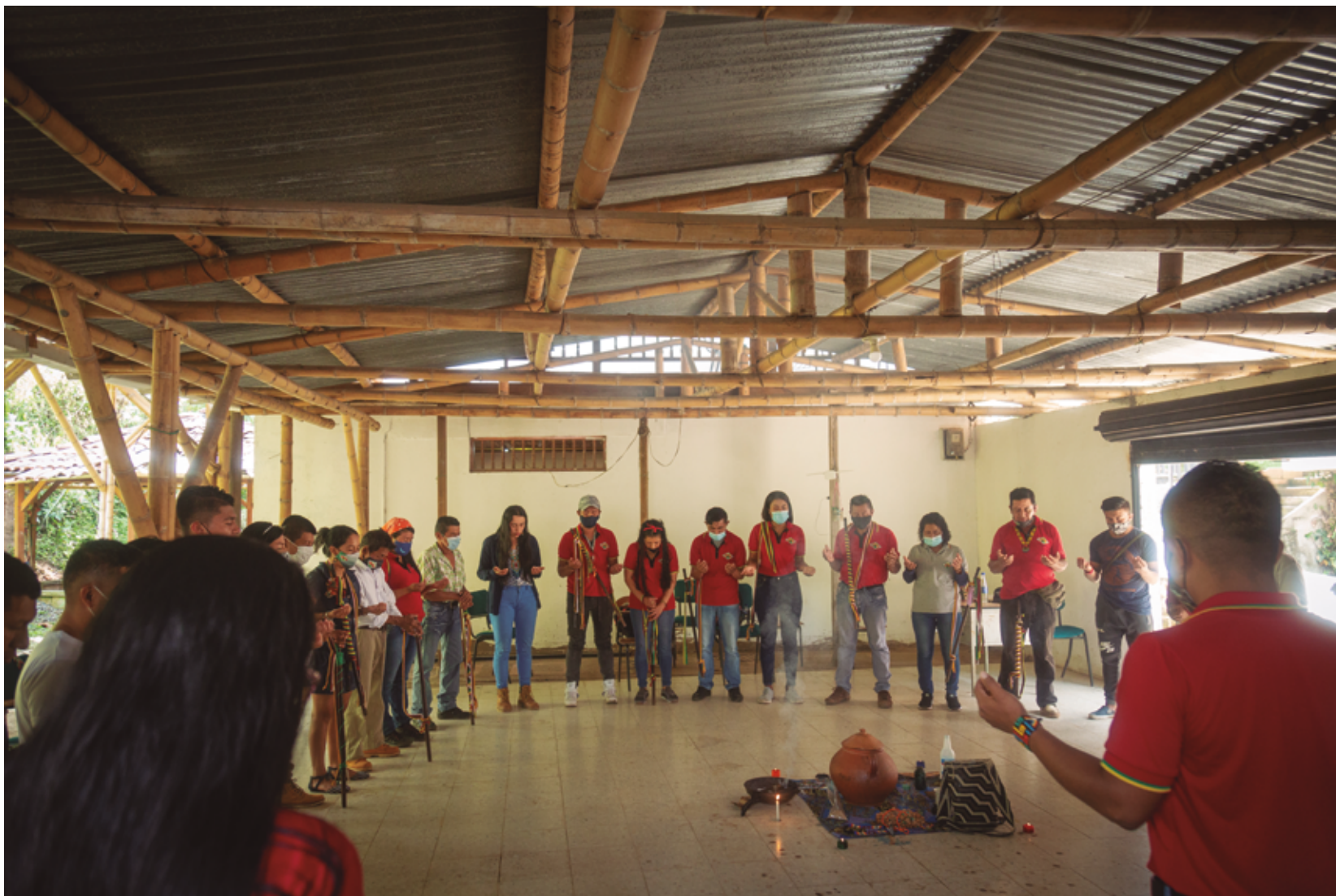
Antes de iniciar cualquier encuentro de cabildantes y autoridades del Territorio Ancestral de San Lorenzo se realiza una armonización, no solo para disponer el espacio y el cuerpo, sino para pedirles sabiduría a los elementales a la hora de tomar decisiones.