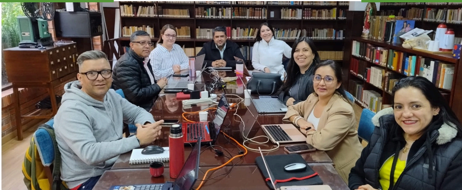
Última sesión de negociación CNMH-SINTRAPAZ.

La negociación colectiva no es solo un derecho laboral, sino también una herramienta de dignidad, diálogo y construcción conjunta de justicia en el ámbito laboral.