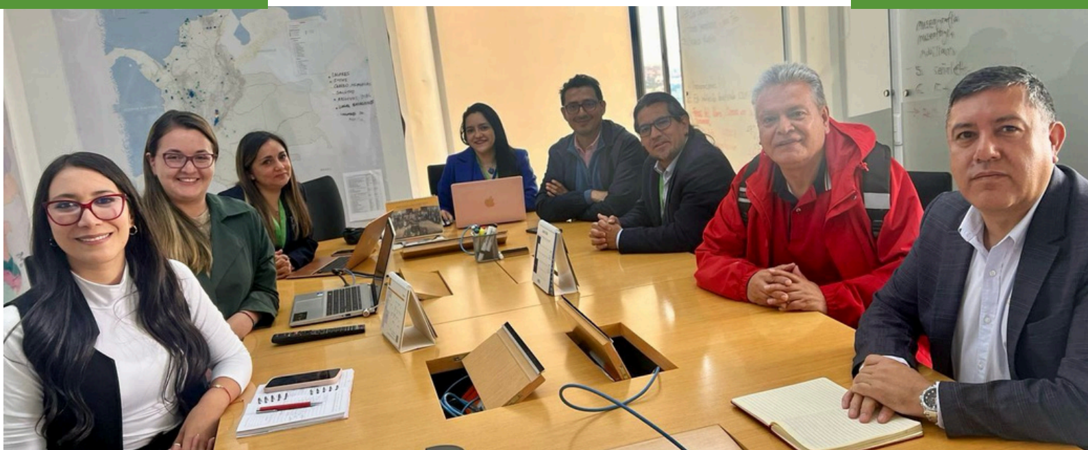
Instalación mesa de negociación CNMH-SINTRAPAZ.

La negociación colectiva no es solo un derecho laboral, sino también una herramienta de dignidad, diálogo y construcción conjunta de justicia en el ámbito laboral.