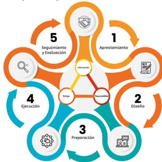
Imagen 1. Etapas del proceso de Rendición de Cuentas