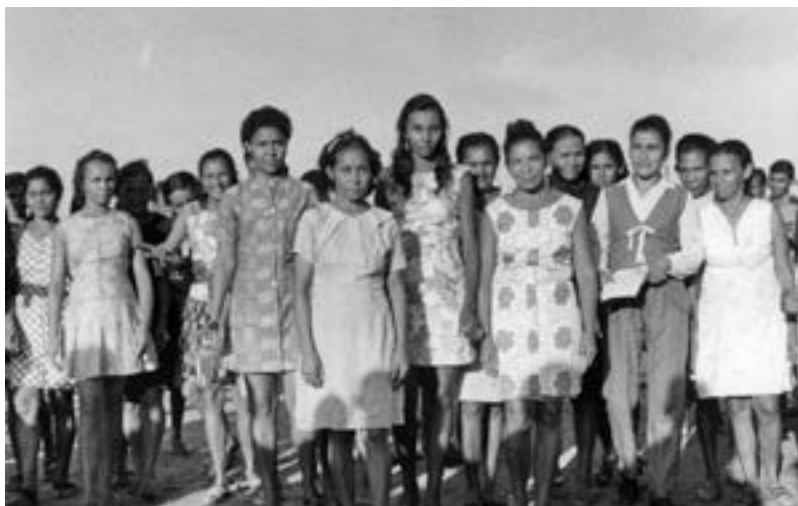
Figura 2. Obra de teatro realizada por mujeres campesinas en función de la concientización de los temas relacionados con la lucha por la tierra, 1970-1971.