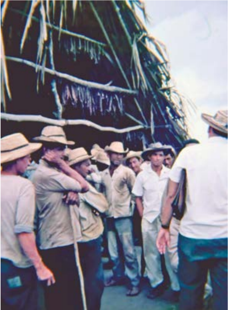
Figura 4. Reunión de campesinos en el caney de tabaco, 1970-1971.

Fuente: Archivo de Derechos Humanos CNMH. Fondo Edelmira Pérez Correa. Proceso del Cultivo del Tabaco 53/55. Co.11001000.00573.01-00-00-01-00-000-0016-00518.