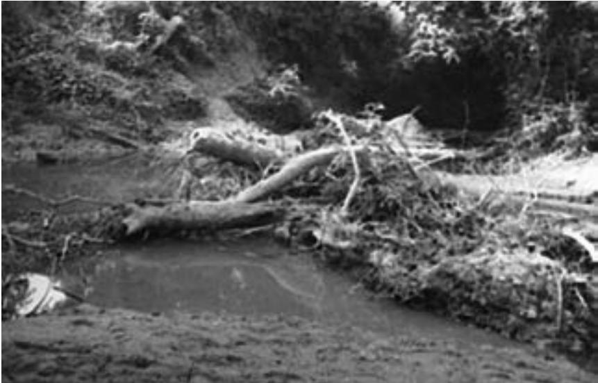
Figura 3. Paisaje Rural después de los estragos dejados por el huracán, 1970-1971.